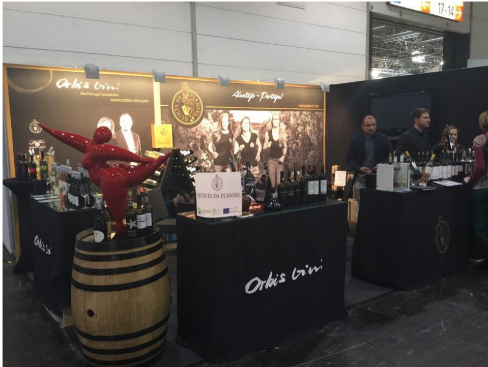
Feira na Alemanha Prowein / Fair in Germany Prowein