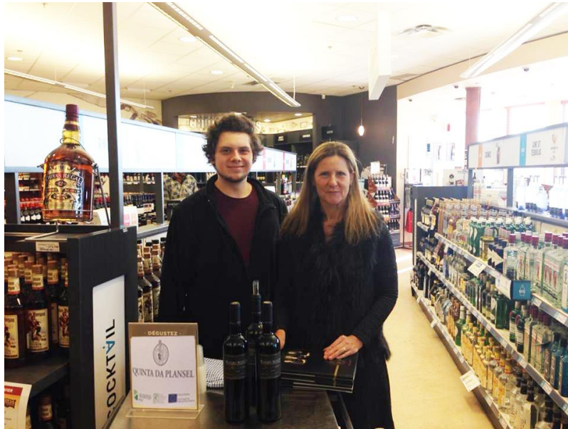
Feira de vinho Canadá / Canada Wine Fair