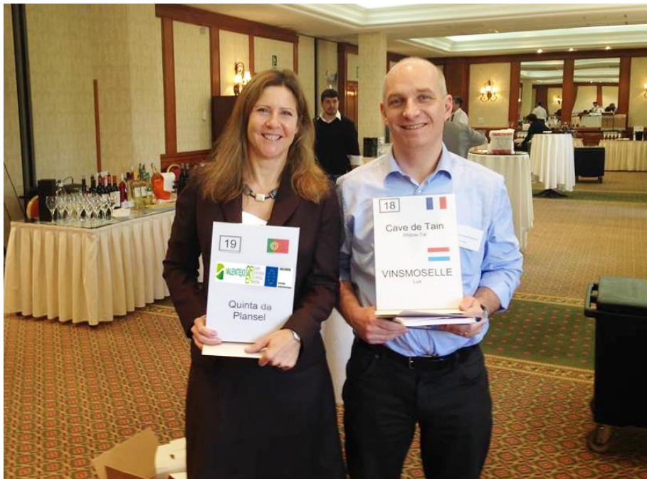
Feira em Mallorca / Mallorca Fair